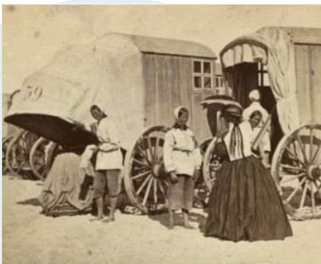
Pruderie sur la plage de Norderney en 1865. Des chariots protègent les gens complètement habillés des regards du public.

Durant la période des Biedermeiers la nudité était considérée comme très indécente. On portait des maillots qui couvraient presque tout le corps, même chez les hommes. Mais même dans ce voilage la nage en public était indécente. Déjà en 1800 il y avait sur Norderney les premiers chariots de natation : des cabines sur roues pour changer les vêtements, qui furent roulées dans la mer pour protéger les nageurs des regards d'autrui.